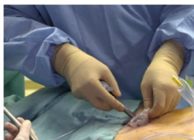
Disposizione delle porte per gli strumenti di lavoro